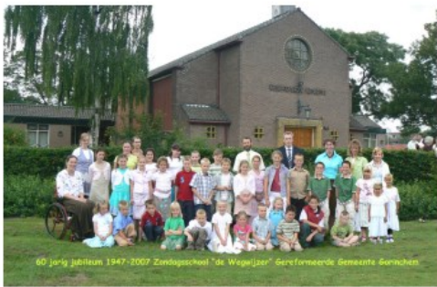
Herinneringen aan 75 jaar Zondagsschool "De Wegwijzer" Gereformeerde Gemeente te Gorinchem

Onze Gorcumse zondagsschool heeft afgelopen jaar haar 75-jarig jubileum mogen vieren. Al enkele jaren vóór de oprichting kwamen de kinderen van de Gereformeerde Gemeente van Gorinchem bij elkaar, maar pas vanaf 1947 was de oprichting van een officiële zondagsschool een feit.