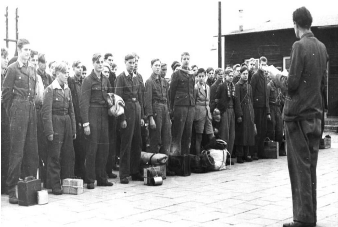
Aankomst NSB jongeren bij een opvangkamp